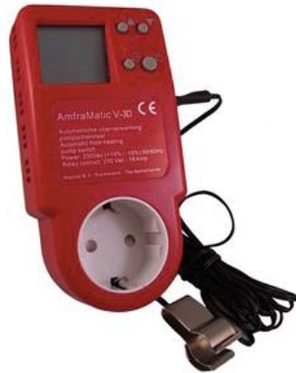
Pompschakelaar AmfraMatic V-3DP

Vloerverwarming? Gebruik thermische pompschakelaar